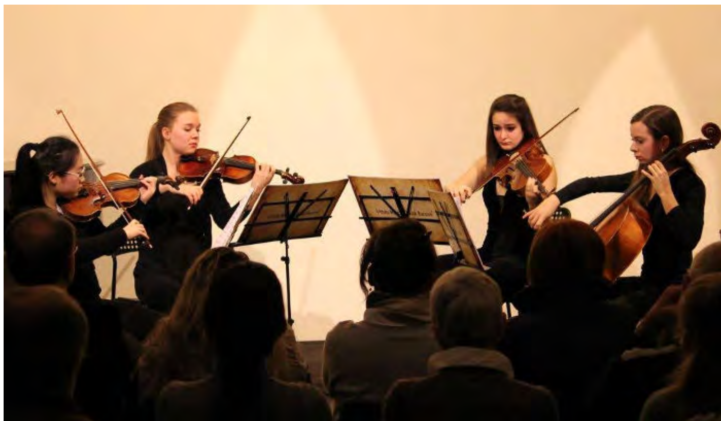
Quartetto d'archi Consonante

Cremona. Tre quartetti d'archi formati da musicisti teenager: domenica 4 settembre i riflettori dell'Auditorium Giovanni Arvedi sono puntati sui giovani talenti, per testimoniare concretamente come sia possibile fare grande musica anche a 14 anni.