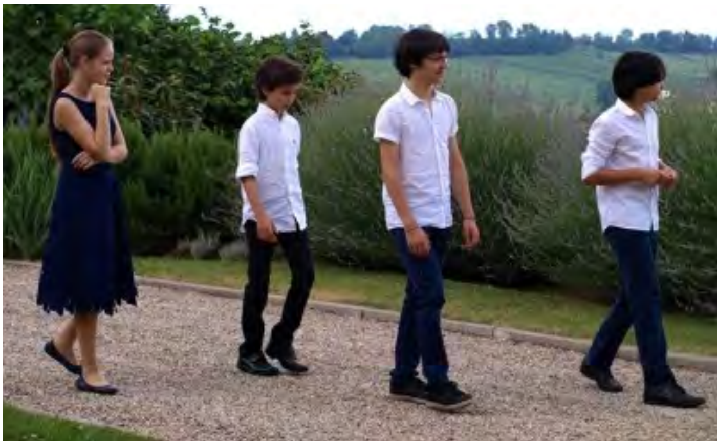
Quartetto d'archi Tatoleki