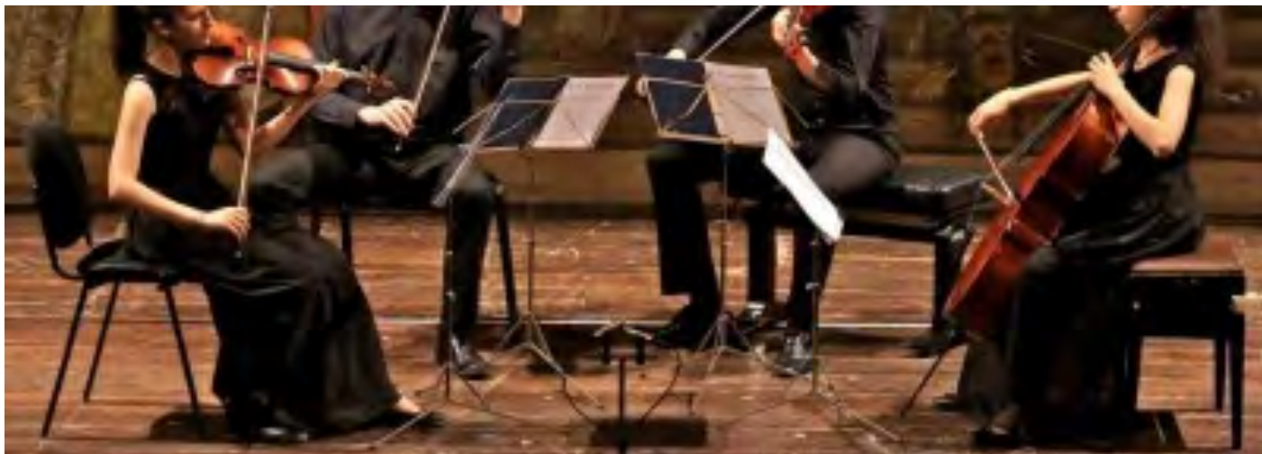
Quartetto d'archi Dàidalos

Rodolfo Halffter, Ocio tientos op. 35 n. 5